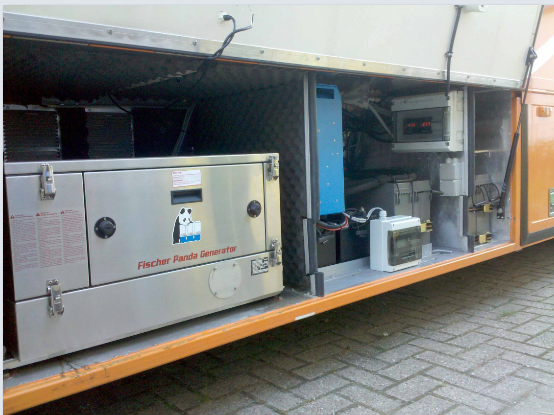
Foto 1: de Fischer Panda generator, aangesloten op de Victron Quattro.