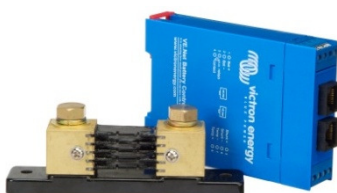
VE.Net Battery Controller