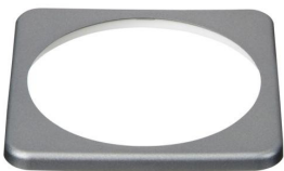
BMV vattingsring vierkant