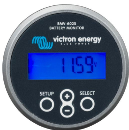
BMV 602S Black

Geen prescaler nodig. Opmerking: RJ45 connectors zijn galvanisch geïsoleerd van Controller en shunt.