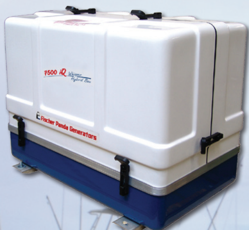
Panda 7500iQ Whisper HybridBox

Tijdens de METS (Marine Equipment Trade Show) in Amsterdam introduceerde Fischer Panda een nieuwe 'all-in-one' stroomoplossing: de Panda 7500iQ Whisper HybridBox. Deze compacte unit combineert een moderne toerentalvariabele generator met een walstroom aansluiting en een efficiënte manier om de accu op te laden. In de HybridBox is een Quattro 24/3000/70 geïnstalleerd, welke zelfs onder de meest ongunstige omstandigheden 230 Volt levert.