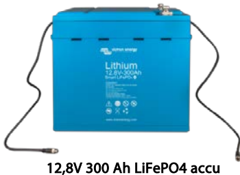
12,8V 300 Ah LiFePO 4 accu

Met Bluetooth kunnen cel voltages, temperatuur en alarmstatus worden gecontroleerd. Zeer nuttig om (potentiele) problemen, zoals cel onbalans, te lokaliseren.