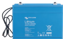
Lithium Battery Smart 12,8 V & 25,6 V-accu