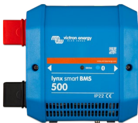
Lynx Smart BMS