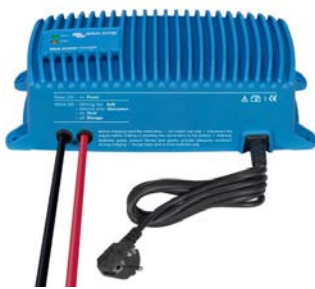
Blue Smart IP67 acculader 12/25