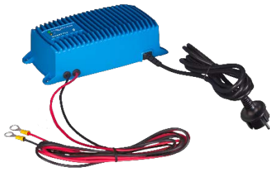
Blue Smart IP67 acculader 12/25