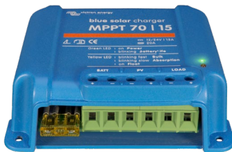
Solar Charge Controller MPPT 75/15