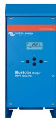
150/70 & 150/85 CAN-bus