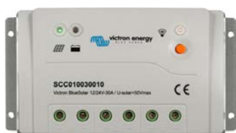
BlueSolar PWM-Pro 10A