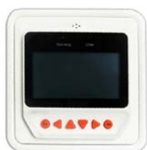
BlueSolar Pro Remote Panel