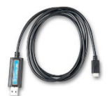
VE.Direct naar USB interface