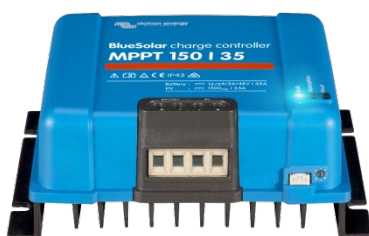
Zonne-laadcontroller MPPT 150/35