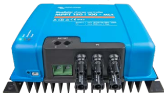
Zonne-laadcontroller MPPT 150/100-MC4