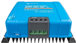
Zonne-laadcontroller MPPT 150/100-Tr