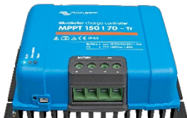
Zonne-laadcontroller MPPT 150/70-Tr