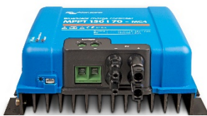
Zonne-laadcontroller MPPT 150/70-MC4