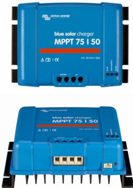
Solar laadcontroller MPPT 75/50