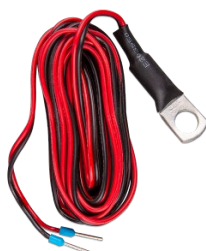
Capteur de température pour les périphériques Quattro, MultiPlus et GX (comme le Cerbo GX)

Cet adaptateur est conçu pour remplacer facilement l'écran CCGX par les GX Touch 50 ou GX Touch 70 les plus récents. Sont inclus le support métallique, la monture en plastique et quatre vis de montage.