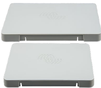
Capot de protection en plastique pour GX Touch 50 et 70