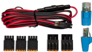
Accessoires inclus avec le Cerbo GX

Le Cerbo GX est facile à monter et peut aussi être monté sur un rail DIN à l'aide de l'adaptateur DIN35 small (non inclus). Son écran tactile séparé peut être boulonné sur un tableau de bord, éliminant ainsi la nécessité de réaliser des coupes exactes (comme avec le Color Control GX). Comme il se connecte facilement avec un seul câble, vous n'aurez pas à amener de nombreux fils jusqu'au tableau de bord. La fonction Bluetooth permet une connexion et une configuration rapides avec notre application VictronConnect.