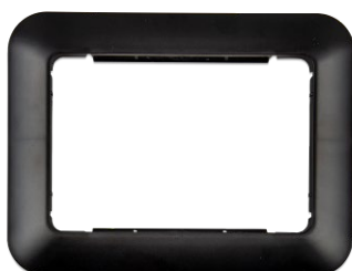
Accessoires en option