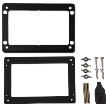
Accessoires inclus avec le GX Touch