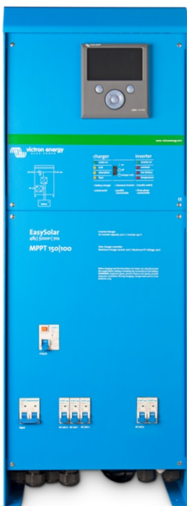
EasySolar 5 kVA

Er staan meerdere softwareprogramma's (assistenten) ter beschikking voor de configuratie van het systeem voor zowel met het elektriciteitsnet interactieve systemen als autonome toepassingen. Zie hiervoor: http://www.victronenergy.nl/support-and-downloads/software/