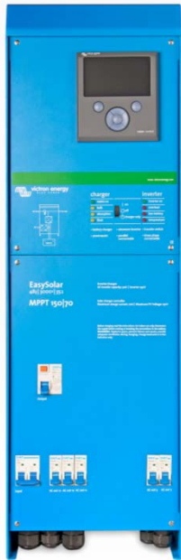
EasySolar 3 kVA