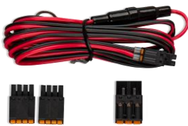
Accessoires inbegrepen met de GlobalLink 520 en 530