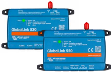
GlobalLink 530 en 520