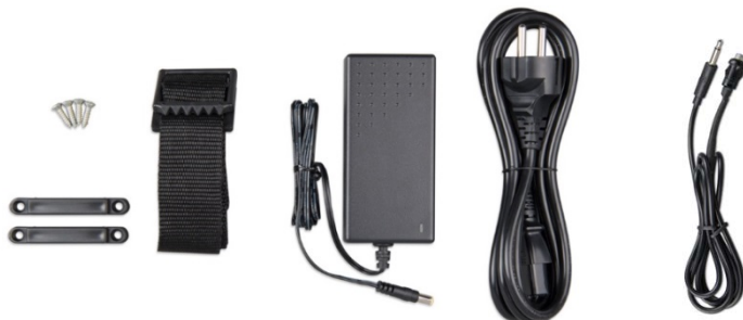
Bevestigingsband Adapter Netsnoer Drukknop met kabel (2 m) en twee kleuren LED