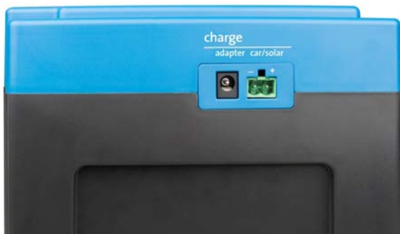
Adapter en ingang voertuig/zonnepaneel (car/solar) (contrastekker voor de car/solar ingang wordt meegeleverd)