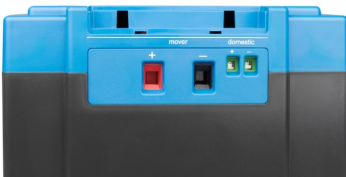
Hoog vermogen uitgang (mover) en laag vermogen uitgang (domestic)