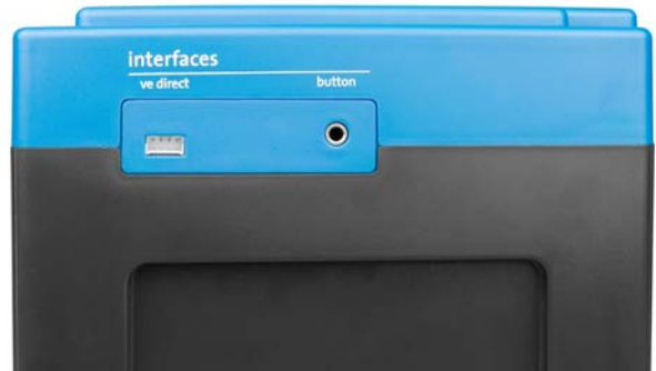
VE.Direct en drukknop