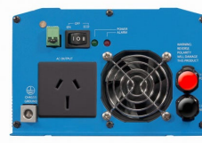
Phoenix omvormer 12/800 met AN/NZS 3112 stopcontact