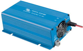
Phoenix omvormer 12/180