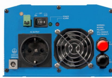
Phoenix omvormer 12/800 met Schuko stopcontact