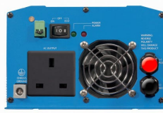
Phoenix omvormer 12/800 met BS 1363 stopcontact