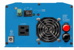
Phoenix omvormer 12/800 met Nema 5-15R stopcontact