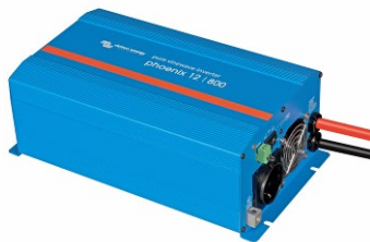
Phoenix omvormer 12/800 met Schuko stopcontact