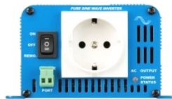
Phoenix omvormer 12/180 met Schuko stopcontact