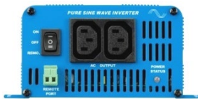
Phoenix omvormer 12/350 met IEC-320 stopcontact