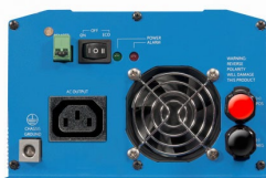
Phoenix omvormer 12/800 met IEC-320 stopcontact