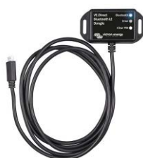
VE.Direct Bluetooth Smart dongle (moet apart worden besteld)

De BMV Battery Monitor combineert een geavanceerd microprocessorsysteem met zeer nauwkeurige meetsystemen voor meting van de accuspanning en de laad-/ontlaadstroom. Daarnaast bevat de software complexe berekeningsalgoritmen om de actuele laadtoestand van de accu precies te kunnen bepalen. De BMV geeft selectief de accuspanning, stroom, verbruikte Ah of resterende tijd weer. De monitor slaat bovendien belangrijke gegevens betreffende de prestaties en het gebruik van de accu op.