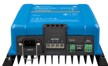
Phoenix Smart 12/50 (3)