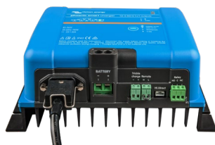
Phoenix Smart 12/50 (1 + 1)