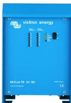
Skylla TG 24 50