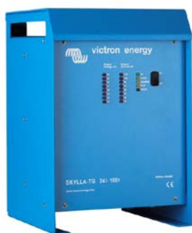
Skylla TG 24 100