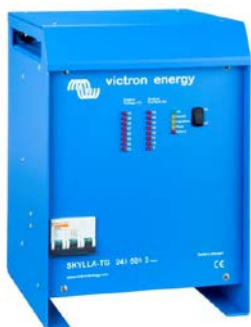
Skylla TG 24 50 3 phase

In ons boek 'Altijd Stroom' kunt u meer lezen over accu's en het laden van accu's (gratis verkrijgbaar bij Victron Energy en beschikbaar op www.victronenergy.com ).