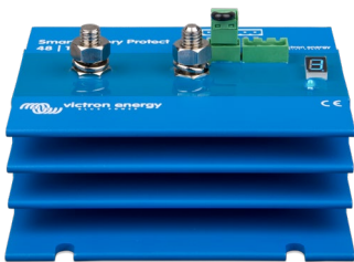
Smart BatteryProtect BP 48-100

La charge sera de nouveau connectée dès que la tension de batterie aura dépassé pendant 30 secondes la tension de reconnexion de charge prédéterminée.