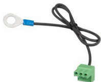
Connecteur avec un câble négatif CC préassemblé (inclus)