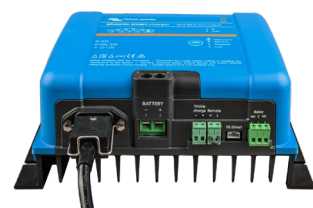
Smart IP43-acculader 12/50 (1 + 1)