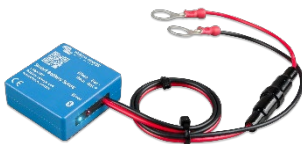
Bluetooth bespeuren: Smart Battery Sense