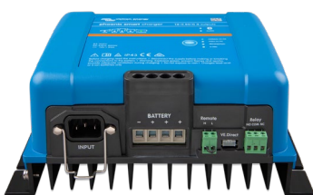
Smart IP43-acculader 12/50 (3)