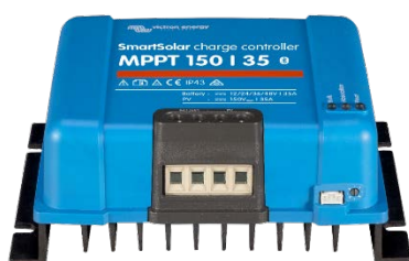
SmartSolar Laadcontroller MPPT 150/35