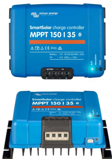
SmartSolar Laadcontroller MPPT 150/35