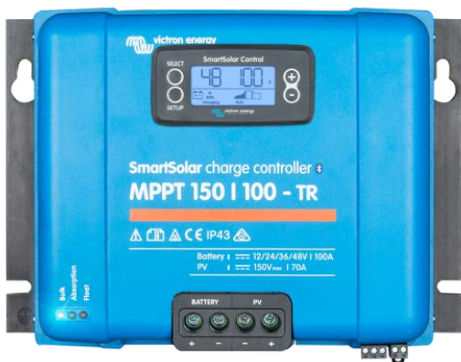
Zonne-laadcontroller MPPT 150/100-Tr met koppelbaar display