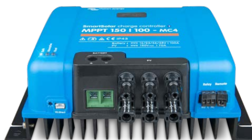
Zonne-laadcontroller MPPT 150/100-MC4 zonder display