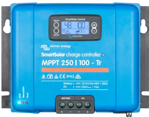
SmartSolar laadcontroller MPPT 250/100-Tr met koppelbaar display