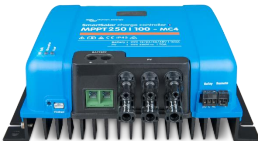
SmartSolar laadcontroller MPPT 250/100-MC4 zonder display