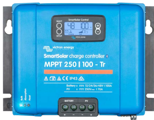
SmartSolar laadcontroller MPPT 250/100-Tr met koppelbaar display

Compenseert absorptie- en druppellaadspanning aan de hand van de temperatuur.