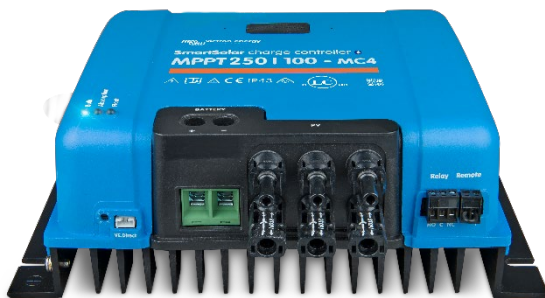
SmartSolar laadcontroller MPPT 250/100-MC4 zonder display