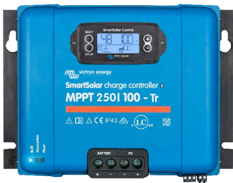
SmartSolar laadcontroller MPPT 250/100-Tr met optioneel koppelbaar display