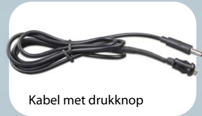
Kabel met drukknop