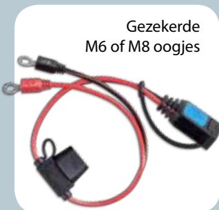
Gezeekerde M6 of M8 oogjes