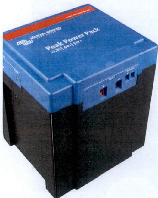
De grootste broer met een capaciteit van 42,67 Ah kan langer energie leveren.

TEKST: ROLF DE ZWART