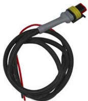
Besturingskabel voor Cyrix-ct 12/24-230 Lengte: 1m