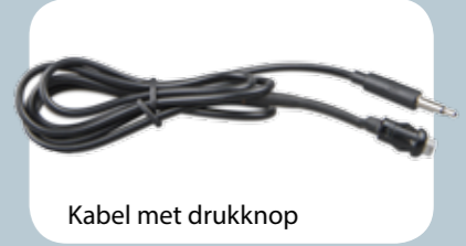
Kabel met drukknop